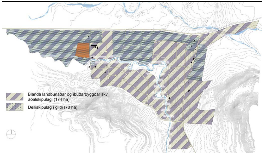
MOSFELLSDALUR BLÖNDUÐ LANDNOTKUN ÍBÚÐARSVÆÐI/LANDBÚNAÐUR

Bornir verða saman ólíkir kostir mið hliðsjón af áhrifum á umhverfi og samfélag í 5. kafla matslýsingarinnar.