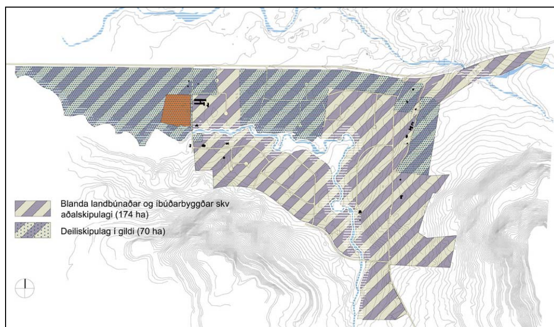
MOSFELLSDALUR, BLÖNDUÐ LANDNOTKUN, ÍBÚÐARSVÆÐI/LANDBÚNAÐUR

Að mestu er um að ræða sléttlend tún. Svæðið er hvorki á náttúruverndar- eða hverfisverndarsvæði og ekki eru fyrirsjáanleg sérstök vandkvæði vegna fráveitumála. Ekki er vitað til þess að skráðar fornminjar séu á svæðinu. Ekki er um að ræða hættusvæði. Á svæðinu gætir umferðarhávaða frá Þingvallavegi.