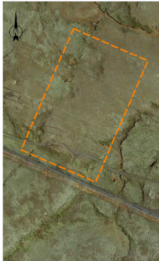
Afmörkun deiliskipulagsins er merkt inn á loftmynd með appelsínugulri brotinni línu.