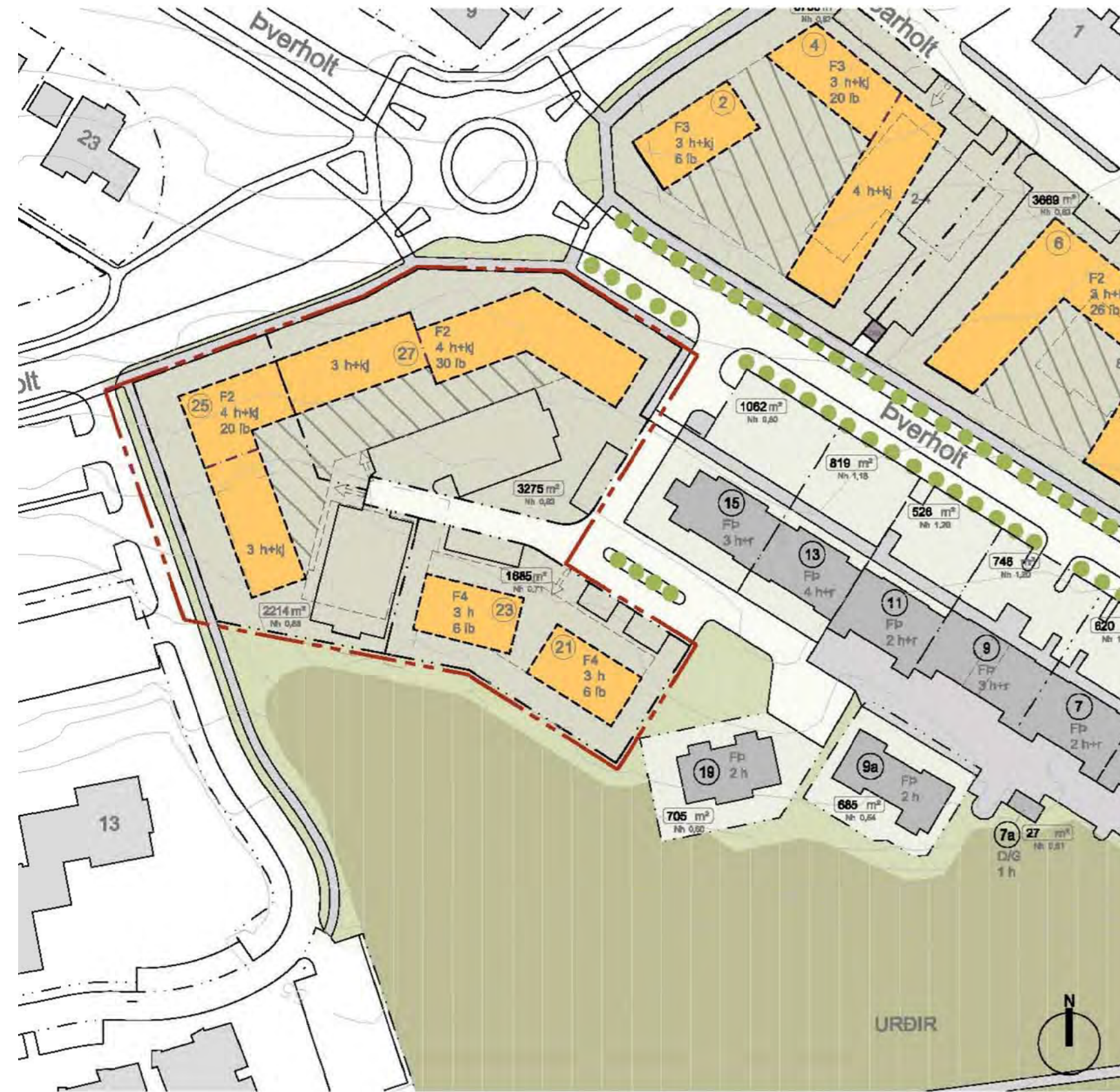
AUGLÝST Í B-DEILD STJÓRNARTÍÐINDA 2. JÚNÍ 2015