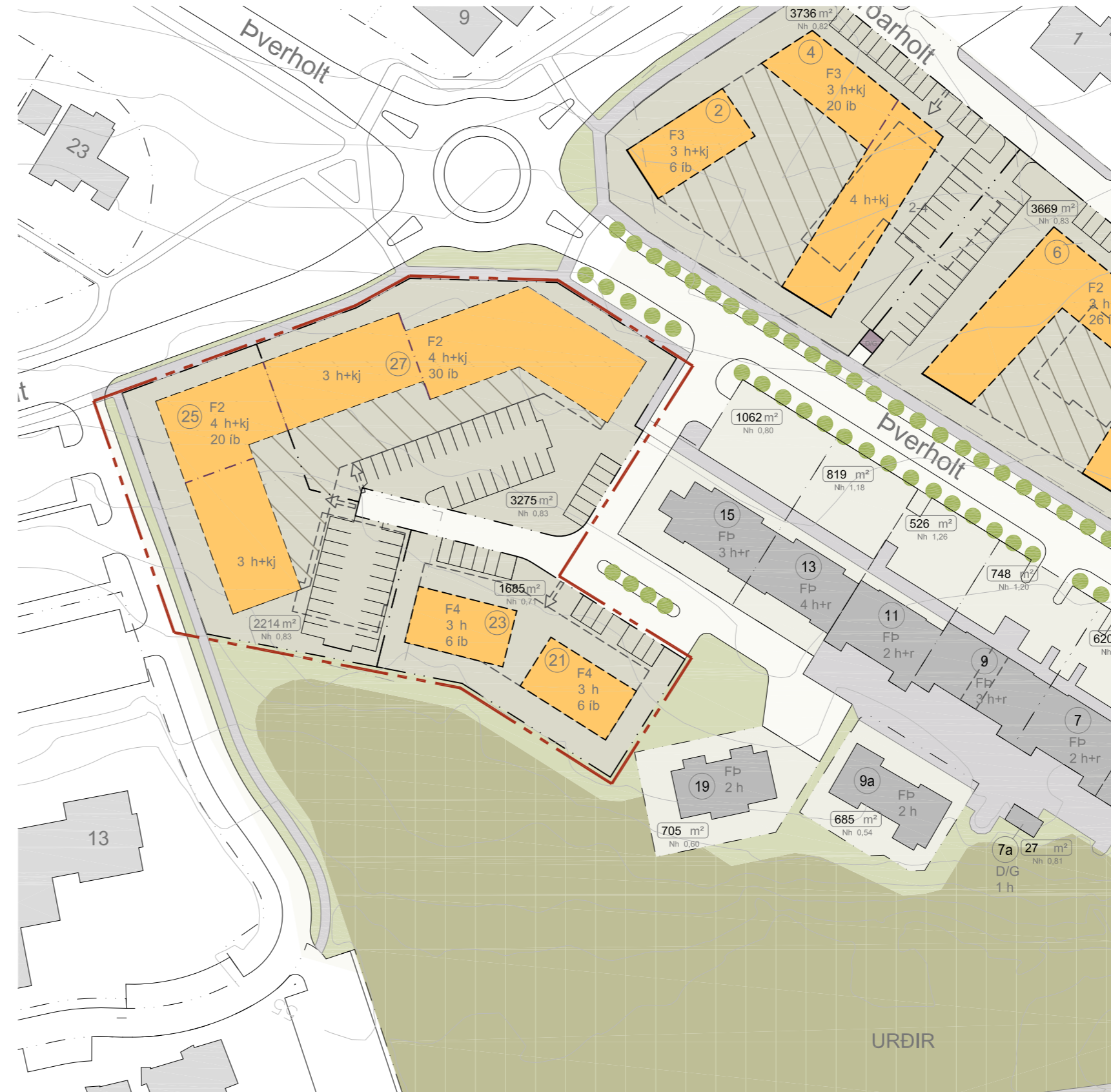
MKV. 1:1000, BREYTT DEILISKIPULAG