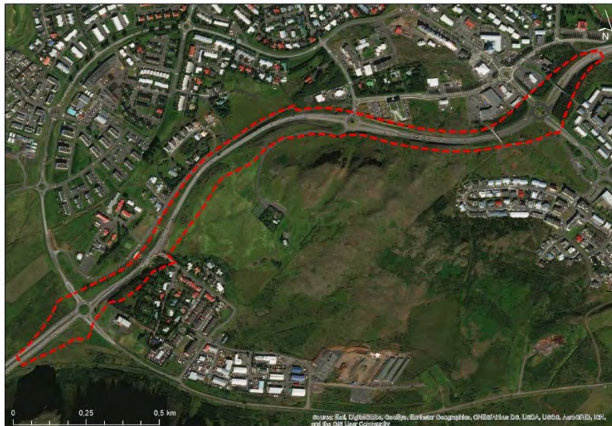
Mynd 3.1 Fyrirhugað deiliskipulagssvæði á loftmynd Loftmynd: Esri.

Um er að ræða nýtt deiliskipulag. Gert er ráð fyrir að skipulagssvæði taki til veghelgunarsvæðis Vesturlandsvegur; mögulegrar afmörkunar mislægra gatnamóta; og göngu-, hjóla- og reiðstíga við Vesturlandsveg, eins og Mynd 3.1 sýnir. Gert er ráð fyrir að afmörkun skipulagssvæðis geti breyst í skipulagsvinnunni.