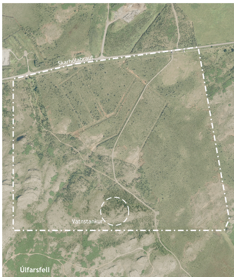
Mynd 1. Yfirlitsmynd – Afmörkun deiliskipulagssvæðis. ( Teiknistofan Stord ehf, 2018 ).

Deiliskipulagið nær til svæðis sem liggur frá Skarhólabraut og upp fyrir staðsetningu á fyrirhuguðum vatnsgeymi. Á skipulagssvæðinu er opið svæði til sérstakra nota og er skógræktarsvæði með reiðstíg sem liggur upp á Úlfarsfell og nokkrar gögnuleiðir frá Skarhólabraut og upp á Úlfarsfell.