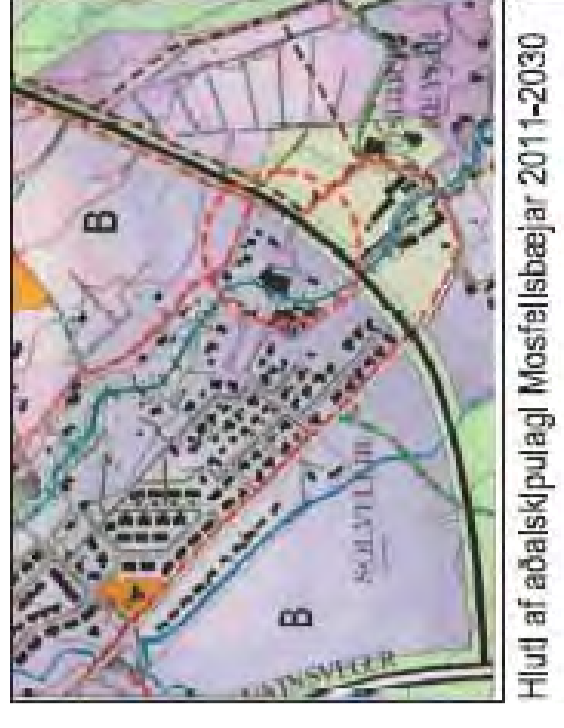
Hluti af aðalskipulagi Mosfellsbæjar 2011-2030

Deiliskipulagsbreyting þessi sem fengið hefur meðferð í samræmi við ákvæði 1. mgr. 43.gr. skipulagslaga nr. 123/2010 var samþykkt Skipulagsnefnd þann..... 2019 og í Bæjarstjórn þann..... 2019