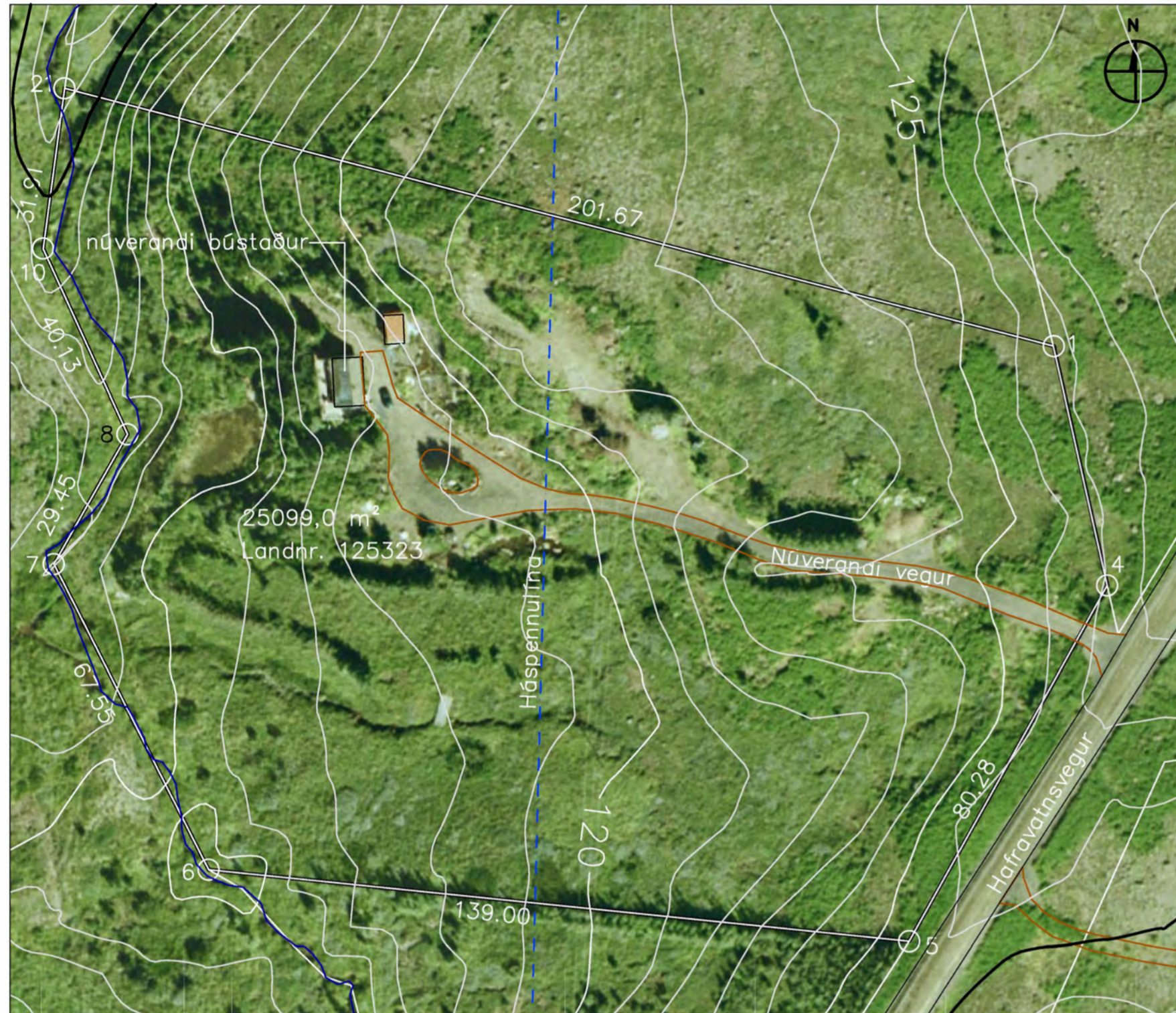
NÚVERANDI DEILISKIPULAG M 1 : 1000