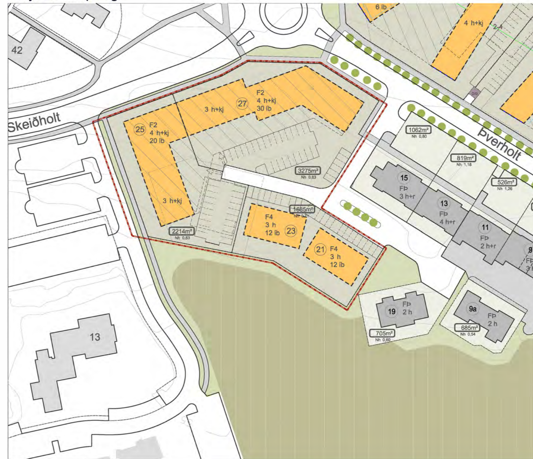
MVK. 1:1000, BREYTT DEILISKIPULAG