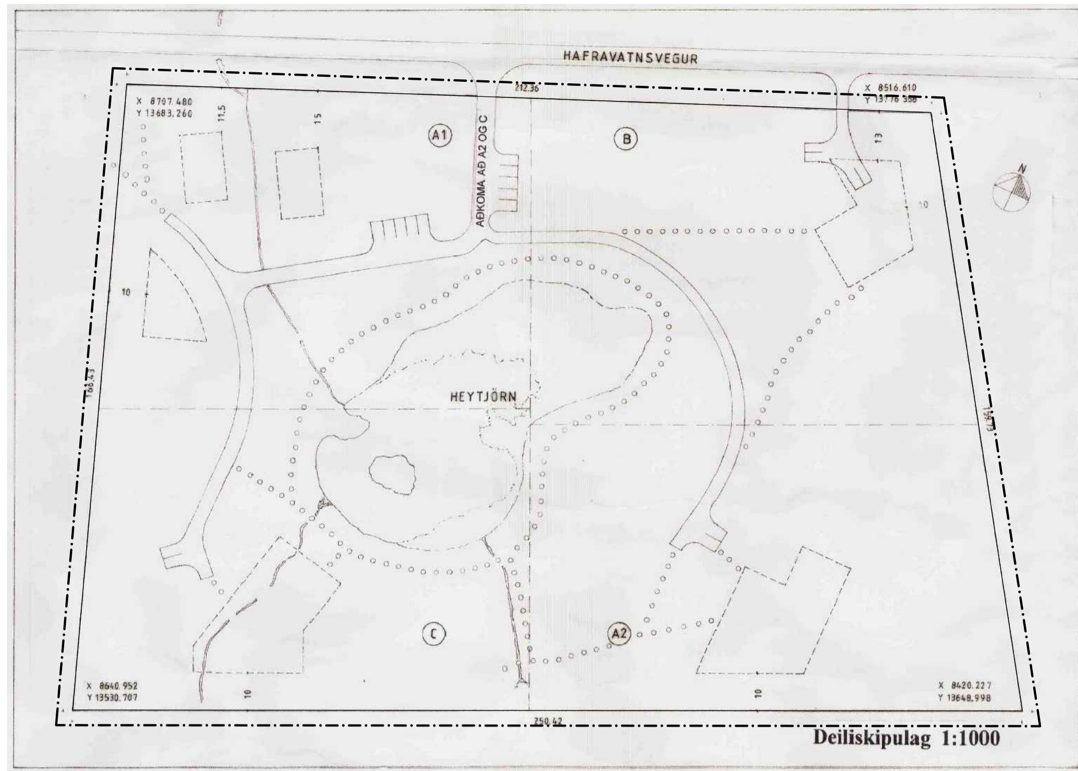
GILDANDI DEILISKIPULAG FYRIR HEYTJÖRN FRÍSTUNDAÞYGGÐ SAMÞYKKT 09.07.2004