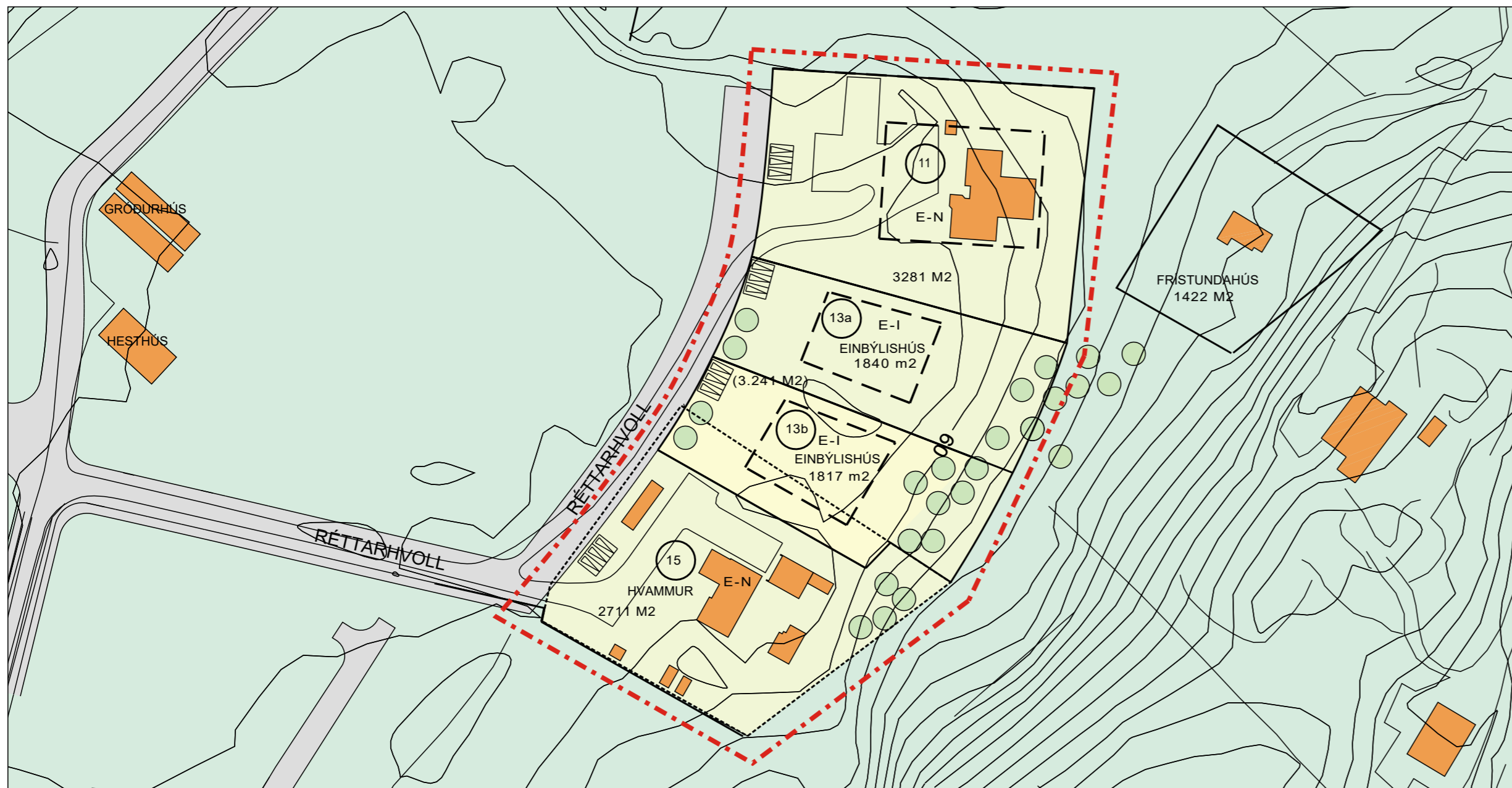
Deiliskipulagsuppráttur - tillaga að breytingu M. 1:1000.