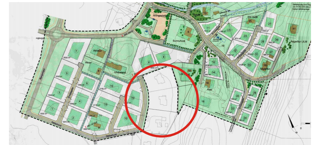
Til skýringar: Deiliskipulag svæðis frá Reykjalandarvegi að Húsadal (ekki í kvarða). Samþykkt í bæjarstjórn Mosfellsbæjar 21.01.2004.