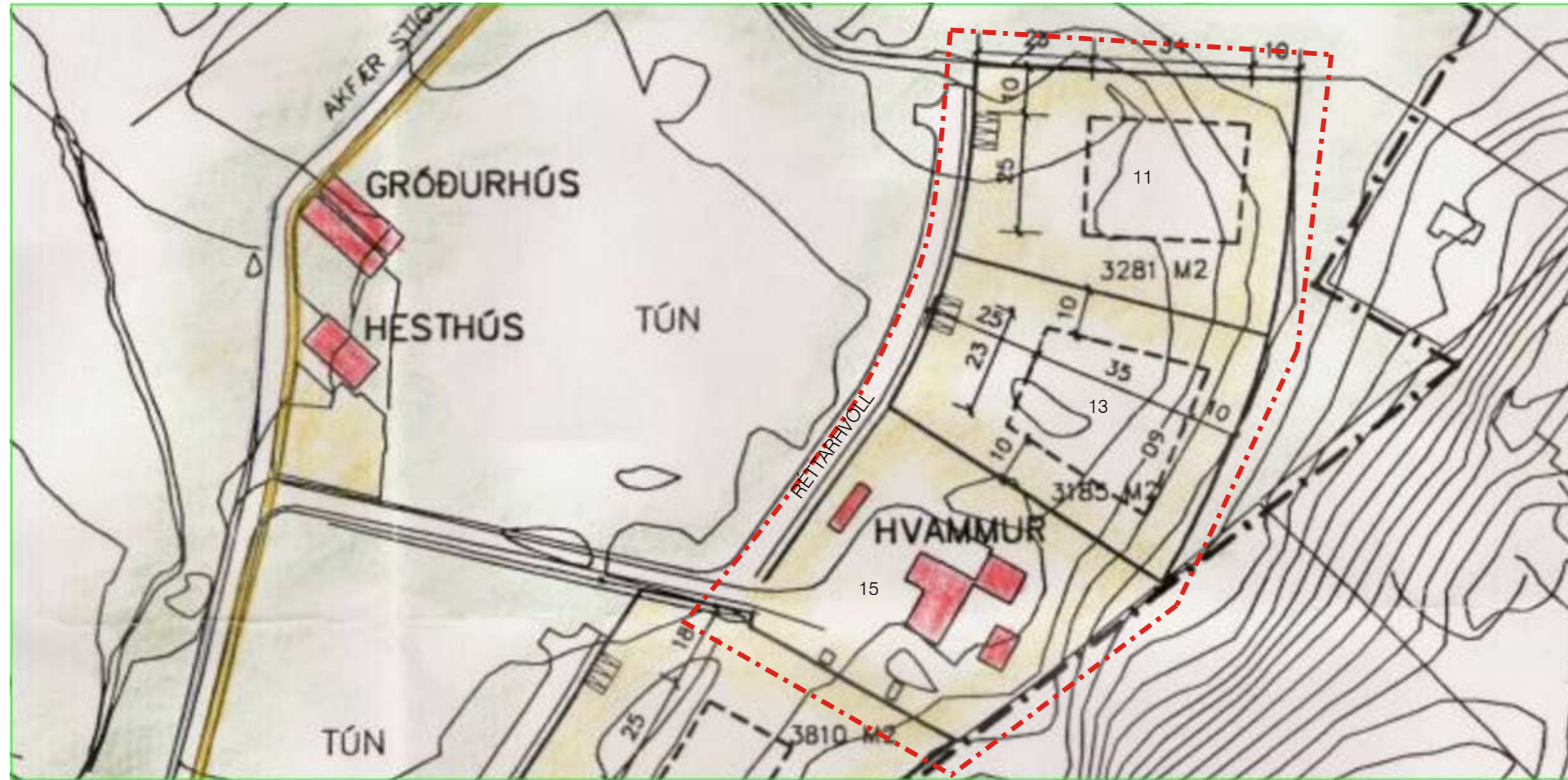
Hluti af gildandi deiliskipulagi sem samþykkt var í bæjarstjórn Mosfellsbæjar þann 2. september 1998. M. 1:1000.