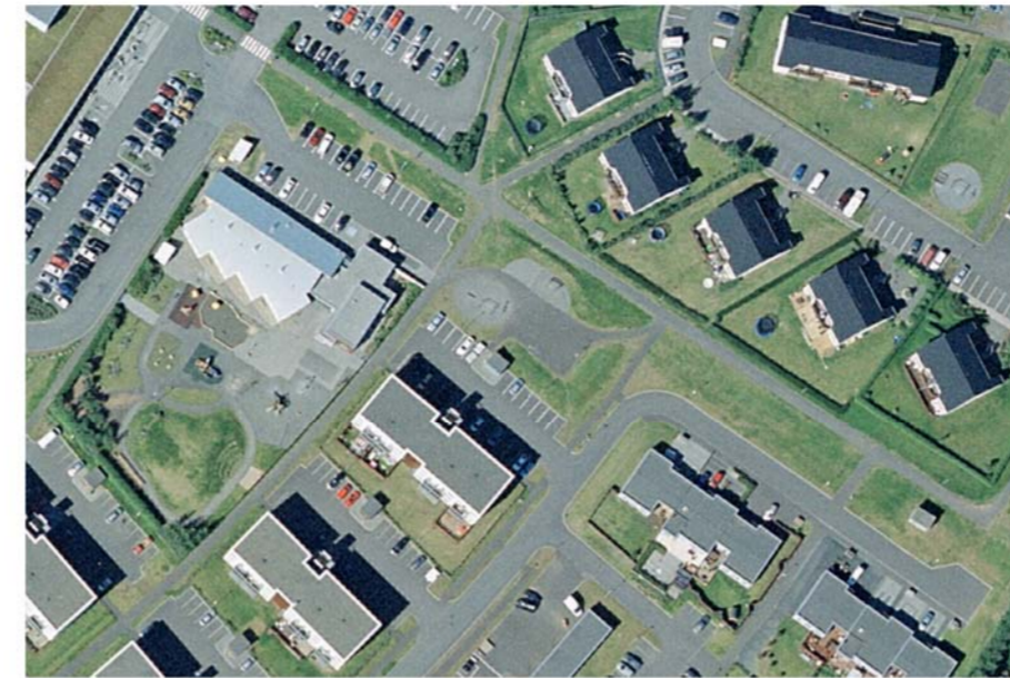
Loftmynd frá 2010 af svæðinu. M. 1 : 2.000